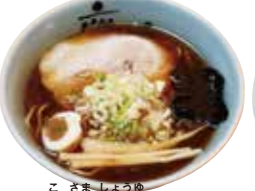
お子様醤油ラーメン 650円