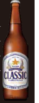
瓶ビール 500円 コーラ 200円 オレンジ 200円 烏龍茶 200円