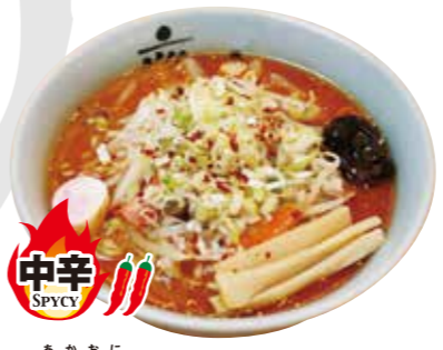
赤鬼 (中辛) 980円