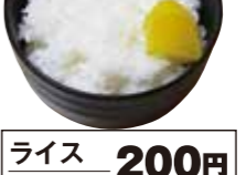
ライス 200円 小ライス 150円