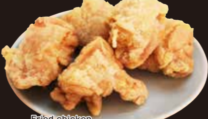
パリカラ3個 480円 パリカラ5個 580円