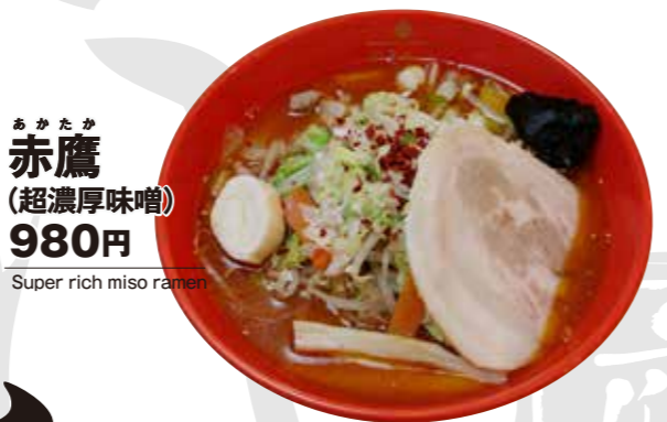
赤鷹 (超濃厚味噌) 980円