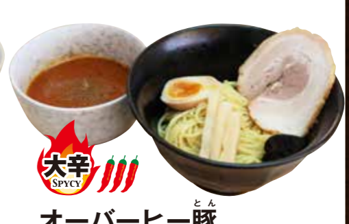
大辛 オーバーヒー豚 (辛いつけ麺) 980円

Noodles accompanied by soup for dipping(spicy)