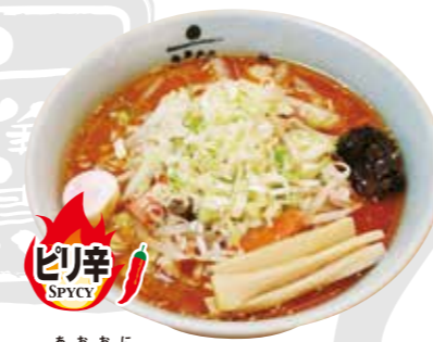
青鬼 (ピリ辛) 980円

Miso ramen with shrimp 海老のエキスを丁寧に抽出した濃厚な味わい!