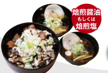
ネギチャセット 1,100円