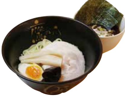
つけ麺 (温or冷) 950円