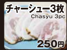
チャーシュー3枚 250円