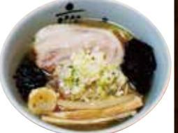
お子様塩ラーメン 650円