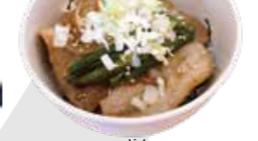
ミニスタミナ丼 380円