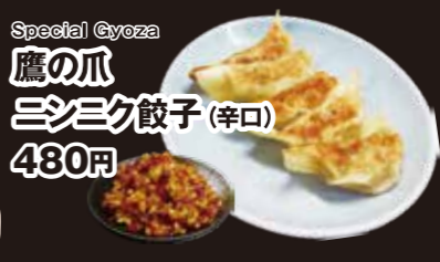
鷹の爪 ミノク餃子 (辛口) 480円