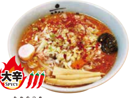
鷹の爪 (大辛) 1,050円