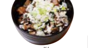
ネギチャーシュー丼 380円